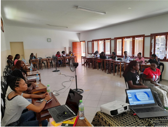
Formação Pedagógica Inicial de Mentoras CDJ Moçambique

Entre as 229 jovens, contam-se 113 adolescentes a estudar na 7ª classe, 40 a estudar na 8ª e 9ª classe e 76 raparigas a estudar ou com a 10ª, 11ª e 12ª classe. As primeiras integraram o programa Acredita. As segundas integraram o programa Crescer. Entre as terceiras 10 estiveram integradas no Programa Lidera e 66 no Programa Descobre. Os Programas Acredita e Lidera bebem da experiência que a PROSOCIAL manteve com a Girl Move entre 2020 e 2021. O Programa Acredita para além de apoio escolar, proporciona uma formação de habilidades para a vida e faz Gestão de Casos de risco, entre outros apoios. Este programa visa reforçar a auto-estima das adolescentes, evitar que engravidem ou casem antes de atingir a maioridade e motiva-las a completarem os