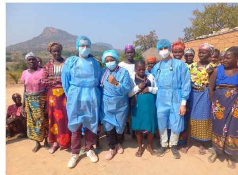
Voluntários em atividade em Angola

Em 2023 as ações de sensibilização e de cidadania foram essencialmente realizadas no quadro dos Projetos co-financiados e das atividades realizadas no EPLA. Para além das mentoras integradas no programa Lidera, destaca-se os 4 voluntários do Núcleo de Estudantes de Medicina da Associação Académica de Coimbra. No total foram realizadas 3791 horas de voluntariado no quadro das atividades onde a PROSOCIAL este envolvida.